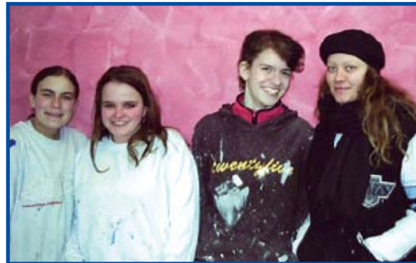
IdA fördert die Chancengerechtigkeit von Frauen im Handwerk